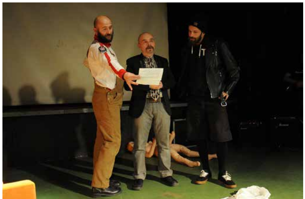
slika desno: „Revolucija“ – 2015. godine – proglas o seksualnoj revoluciji