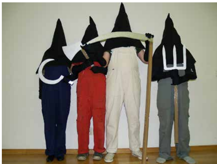
slika desno: kazališno-scenska priprema perofrmansa „BB“ u Kulturnom Centru Peščenica 2012.godine