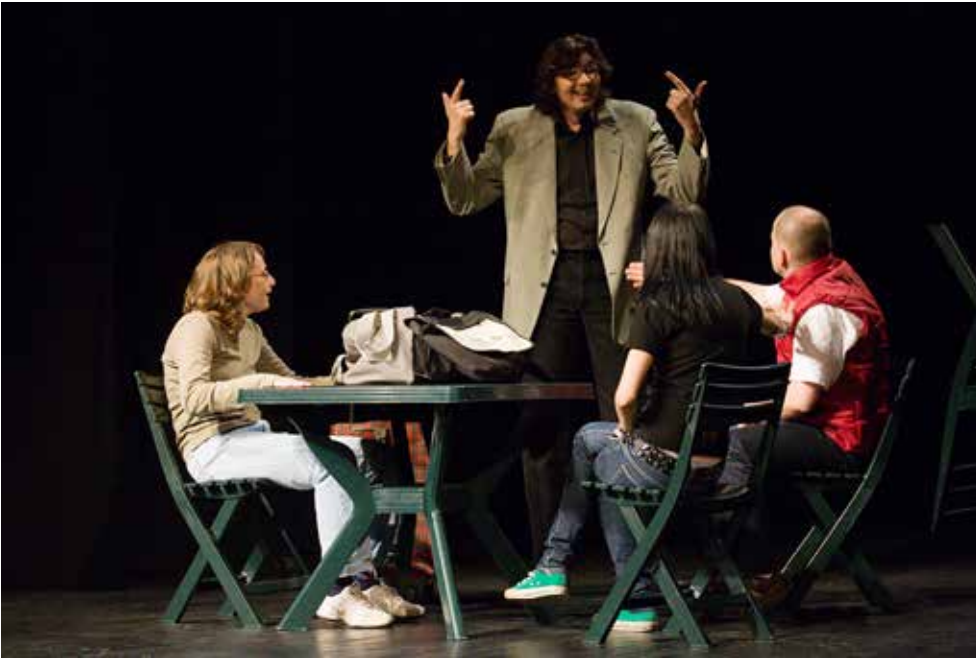
slika lijevo: „Muke i jadi gluhih preprodavača privjesaka – 2008. godine – sastanak bossa sa preprodavačima