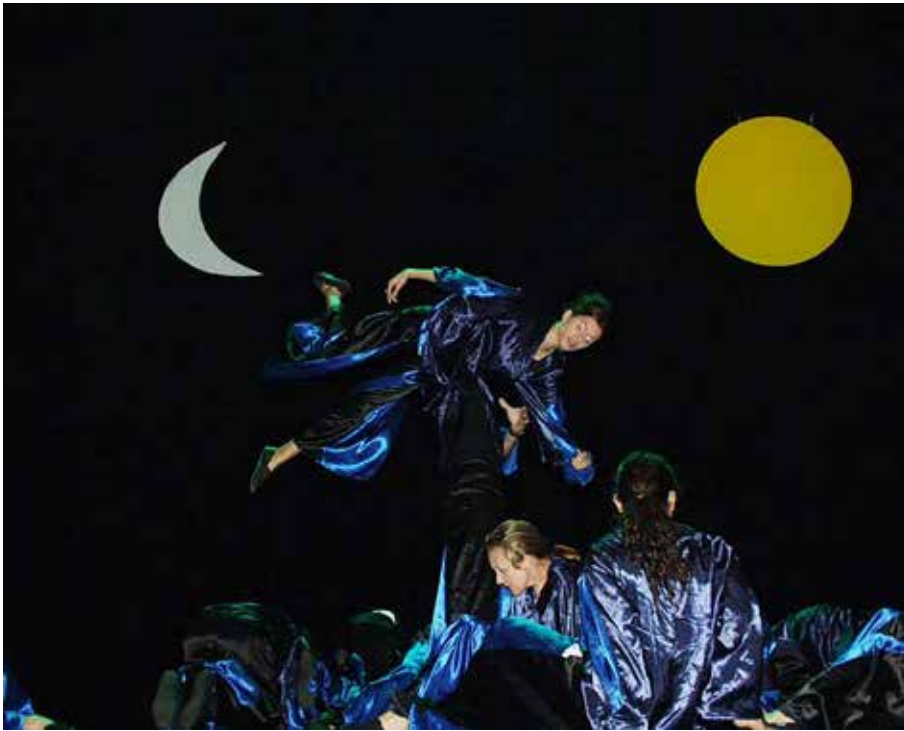
„Planet tišine“, 2001. godine – dio dramsko-plesne predstave u kojem prikazuju „evoluciju flore“