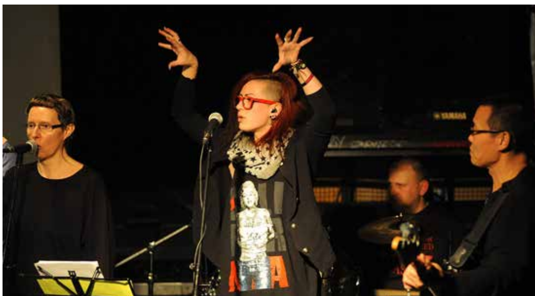
slika lijevo: multimedijalni performans „Što kaže!?“ u URK Močvari 21.12.2016; Deaf band DLAN sa izvedbom pjesme „Rain“ glazbene grupe „Cult“