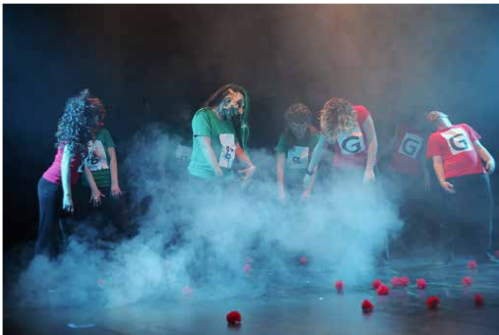
slika lijevo: „Ruke koje plaču – Biti Gluh ili gluh, koga briga!“ – 2010. godine koreografija plesne točke pjesme „Thriller“ Michaela Jackosna