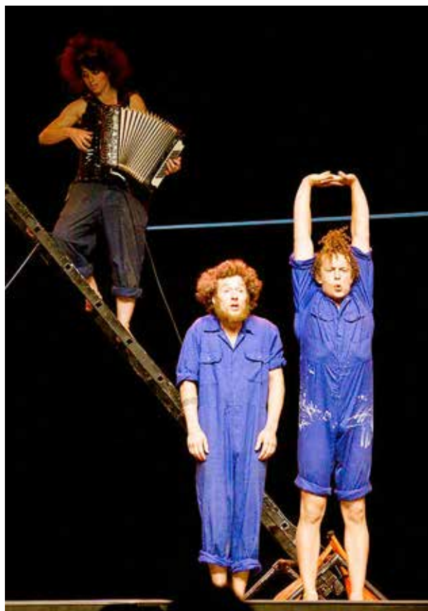
slika gore: skeč "Skok u vis" na festivalu žongliranja u Nizozemskoj, Almere 2016. godine