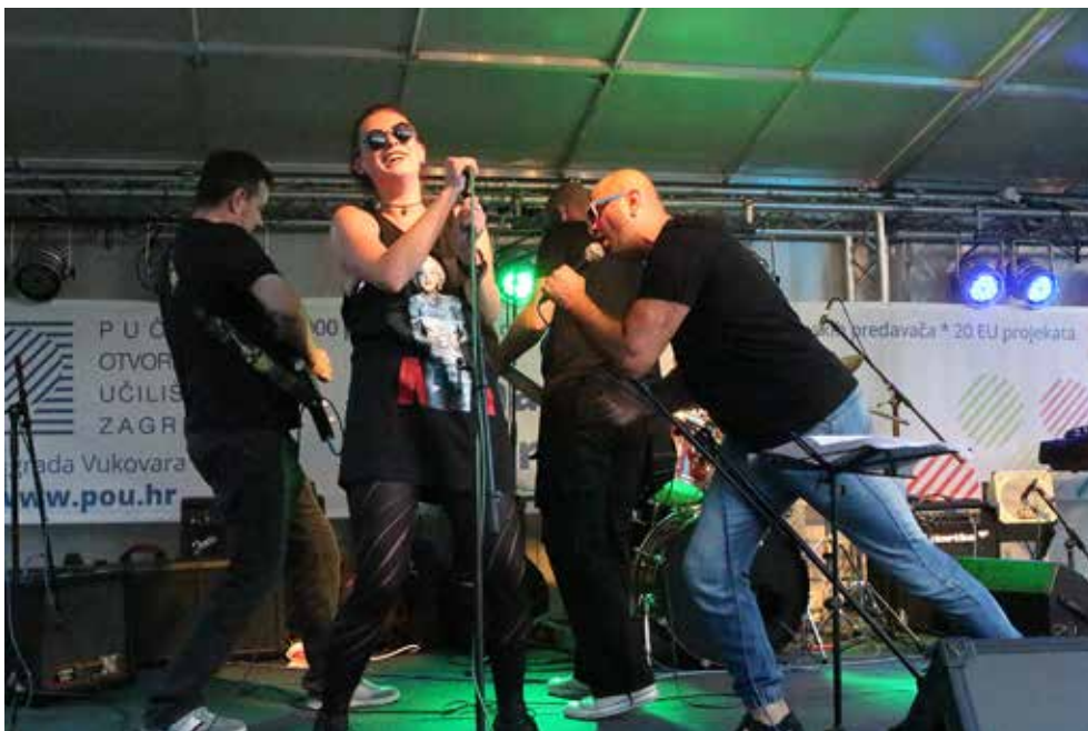
slika lijevo: nastup Deaf Band DLAN-a na Danima Trnja 27.svibnja 2017. sa izvedbom pjesme „Mi plešemo“ glazbene grupe „Prljivo kazalište“