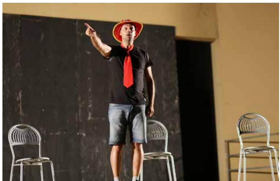
slika desno: performans španjolskog umjetnika Javiera Guisado-a Chavi-ja na Europskom Festivalu „Salvia“ 2016. godine