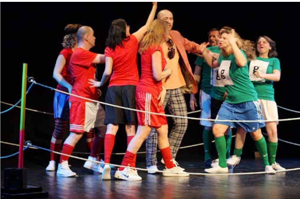
slika lijevo: „Ruke koje plaču – Biti Gluh ili gluhih, koga briga!?“ – 2010. godine - okršaj gluhih i Gluhih u debati