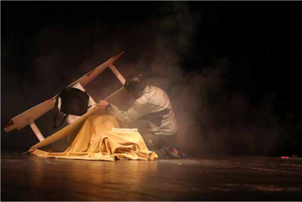
slika lijevo: početak premijere kazališnog performansa „Mali princ“ u Kulturnom Centru Trešnjevka 2015 godine – pilot (Lino Ujčić) pokušava popraviti avion