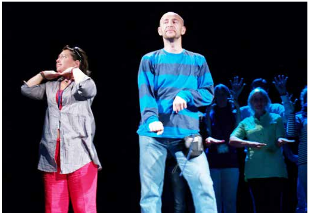
slika desno: prezentacija radionice sa Europskog festivala „Salvia“ u Tallinu 2012. godine