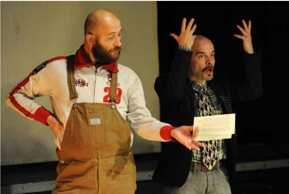
slika lijevo: „Revolucija“ – 2015. godine – proglas o seksualnoj revoluciji