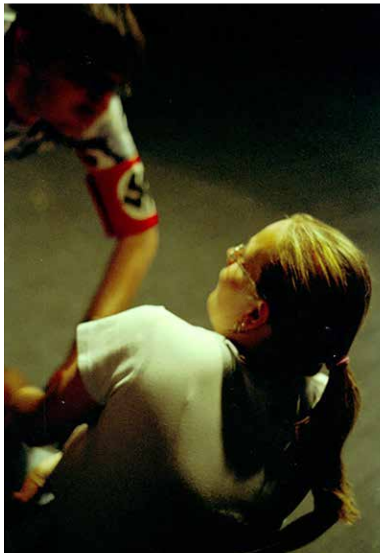
„Ruke koje plaču“, 2006. godine – dramsko-scenska priprema predstave