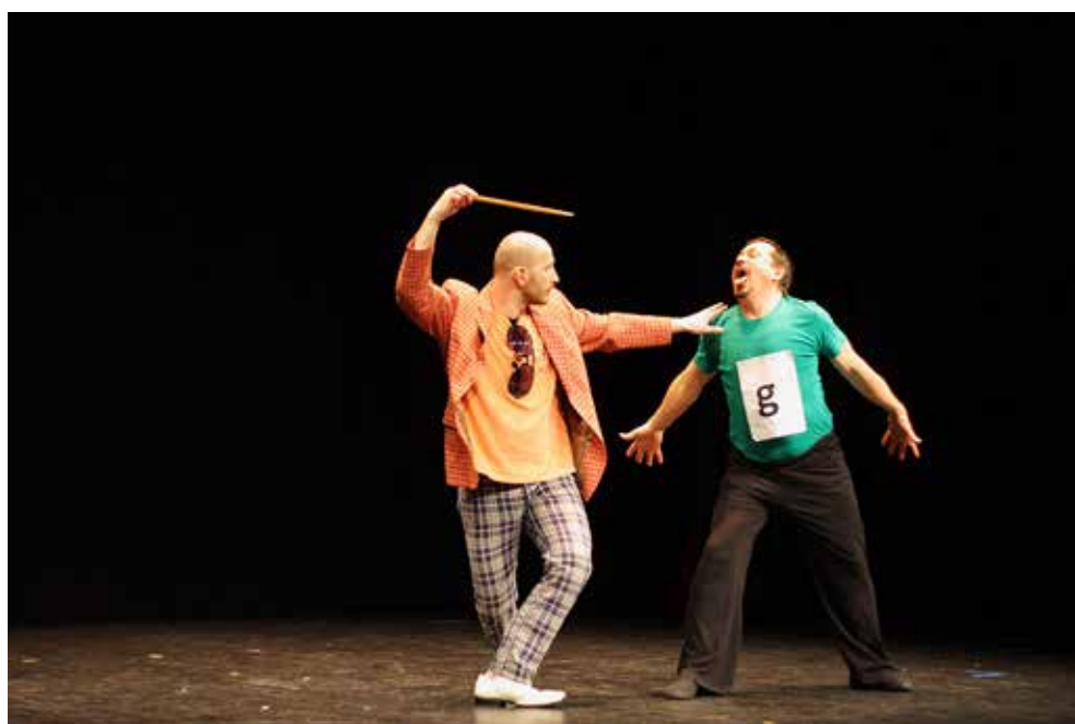
slika lijevo: „Ruke koje plaču – Biti Gluh ili gluh, koga briga!?” – 2010. godine – kadar govornih vježbi