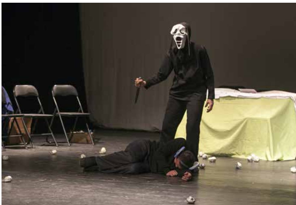
slika lijevo: kraj predstave „Ruke koje plaču – Katastrofa“ go- dina 2014 u Kulturnom Centru Trešnjevka