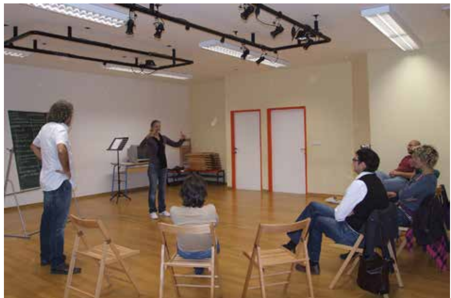
slika desno: radionica poezije na znakovnom jeziku „Visual Vernacular“ za gluhe i nagluhe osobe u vodstvu talijanskog performeru Giuseppea Giuranne