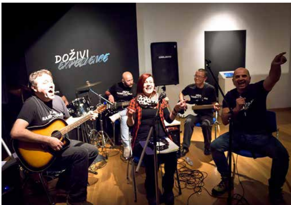
slika lijevo: nastup Deaf Band DLAN-a povodom Noći muzeja u Tiflološkom muzeju 27.siječnja 2017. sa izvedbom pjesme „Mi plešemo“ glazbene grupe „Prljivo kazalište“