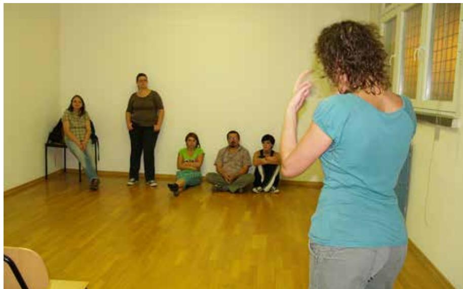
slika desno: radionica za gluhe i nagluhe osobe u vodstvu češke dramske umjetnice Petre Vanurove