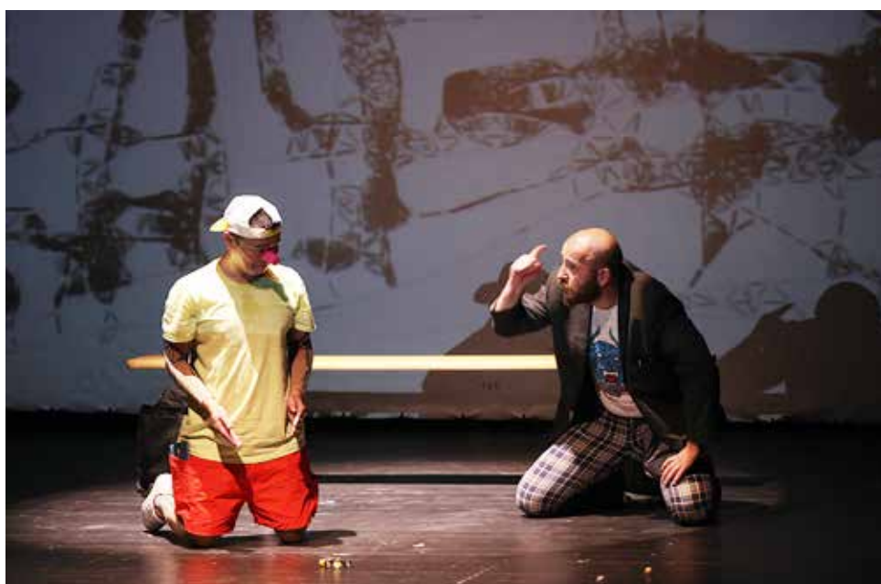
slika desno: premijera kazališnog performansa „Pinokio“ u Kulturnom Centru Trešnjevka 2014. godine – Pinokio i Lisac u igri sa pikulama