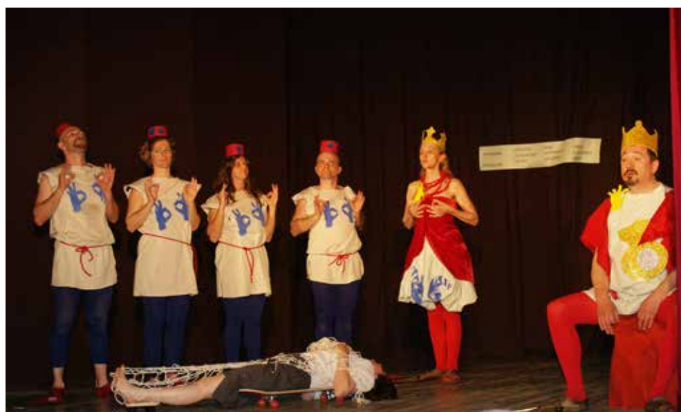
slika desno: performans „Gulliverova putovanja“ u Slavonskom Brodu povodom obilježavanja 55. godišnjice osnivanja Udruge UGIN-BPZ, 30. 4. 2011.godine