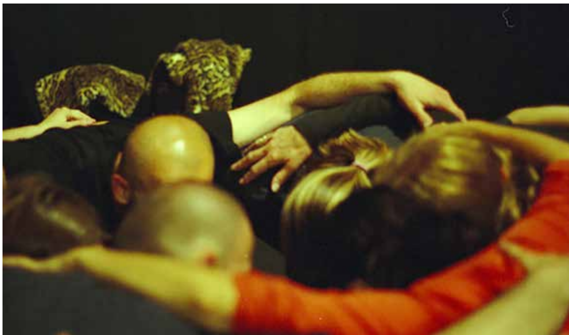
„Ruke koje plaču“, 2006. godine – dramsko-scenska priprema predstave